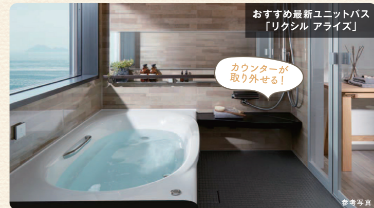
おすすめ最新ユニットバス「リクシル アライズ」

浴室の掃除は、浴槽の掃除が楽になるだけで大きく変わります。洗剤を入れておけばスイッチ1つで自動洗浄する浴槽や、コーティングによりシャワーをかけるだけで皮脂汚れが落ちる浴槽もあります。床材も乾きやすく、汚れのつきにくい表面加工をしたものがありますので、リフォームの際に交換しておくとお掃除がさらに楽になります。