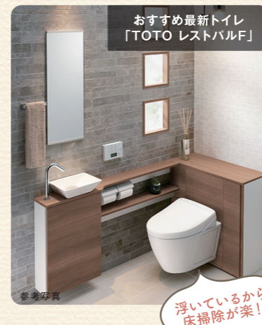
おすすめ最新トイレ「TOTO レストバルフ」

毎日使うトイレですが、掃除となるとちょっと億劫に感じてしまいますよね。最近では、汚れが付くのを防ぐ凹凸のないフラットなデザインの便器が主流となっています。中にはフチに折り返しがなく、黒ずみのたまりやすかったフチ裏掃除から解放されるタイプの便器もあります。タンクレスタイプの便器はスペースそのものを広く使え、掃除がしやすくなるのでおすすめです。床や壁も、においや汚れが付きにくく、継ぎ目がないフラットな素材を選ぶと掃除が楽になります。また、「フローティングデザイン」という壁に設置するタイプの便器もあり、トイレの床掃除を楽にしてくれるので人気。