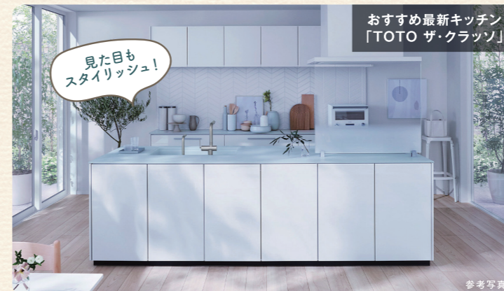
おすすめ最新キッチン「TOTO ザ・クラッシュ」

キッチンは、作業台の素材がガラス素材やセラミックのものを選んでおくと掃除が簡単になります。最新の素材でできたキッチンは拭くだけで汚れをきれいに落とせます。最近ではシンクやキャビネットまでがステンレスでできた「オールステンレスタイプ」のキッチンも人気です。また、掃除が大変ガスコンロはトッププレートがガラスでできている仕様や、IHクッキングヒーターなら、表面に凹凸がないので、拭くだけで清潔に保つことができます。